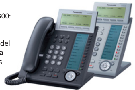
Teléfonos específicos IP de la serie KX-NT300

Los teléfonos IP de la serie KX-NT300 te llevarán a experimentar una nueva dimensión del sonido, una mayor productividad en las comunicaciones, conectividad de red de banda ancha y una mejor atención al cliente. Estos teléfonos IP te ofrecerán las ventajas de los avanzados sistemas de central IP KX-TDE, por lo que dispondrás de un acceso rápido a toda la variedad de aplicaciones y funciones de la central KX-TDE.