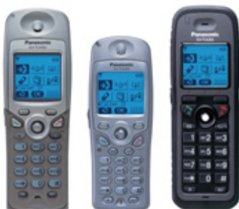
Teléfonos inalámbricos DECT de la serie KX-TCA

La central KX-TDE acepta movilidad inalámbrica gracias al sistema DECT multicelular integrado. Este sistema permite una entrega automática entre las células inalámbricas instaladas, mejorando la cobertura y proporcionando una verdadera movilidad de comunicación incluso en instalaciones muy grandes.