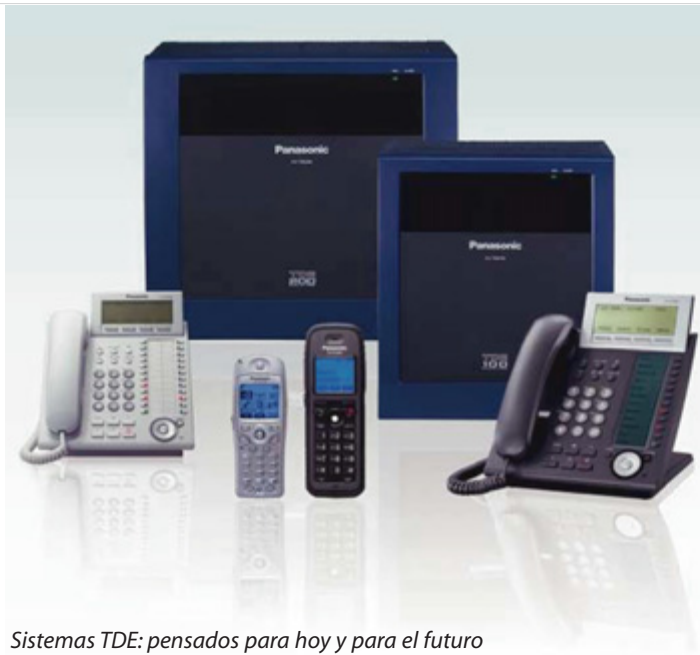
Sistemas TDE: pensados para hoy y para el futuro

Invertir en un sistema de telecomunicaciones requiere una previsión de las necesidades de comunicación de la empresa. Las empresas tienen que poder comunicarse eficazmente, pero también quieren estar seguras de que disponen de las mejores herramientas para gestionar las crecientes demandas de sus necesidades de comunicación futuras. Totalmente modulares y con la última tecnología SIP, las nuevas centrales IP KX-TDE son la plataforma de comunicación ideal para que los clientes puedan resolver todas las necesidades de telefonía de su empresa actuales y futuras puesto que disponen de telefonía IP.